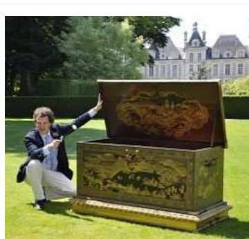
An Edo-era Japanese chest seen in this photo was purchased for 7.3 million euros on June 9.

Rouillac points out how the design of the two chests resembles Hatsune Furniture, the marriage trousseau of Tokugawa Chiyohime, a daughter of Tokugawa Iemitsu, the third shogun of the Tokugawa dynasty.