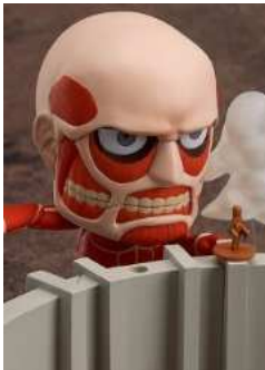
進撃の巨人 ねんどろいど 超大型巨人 & 進撃のプレイセット (ノンスケール ABS&PVC塗装済み可動フィギュア)

2013-07-16 : ニュース・政治・経済 : コメント 102 : トラックバック 0