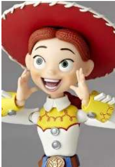
特撮リボルテック SERIES No.048 JESSIE