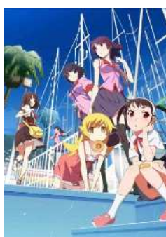
傾物語 第一巻/まよいキョンシー(上) (完全生産限定版) [Blu-ray] 傾物語 第二巻/まよいキョンシー(下) (完全生産限定版) [Blu-ray]