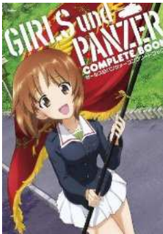
ガールズ&パンツァー コンプリートブック