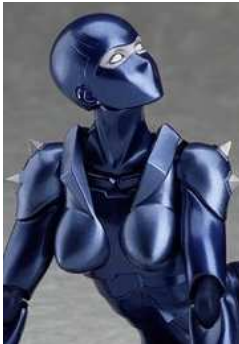
figma COBRA THE SPACE PIRATE レディ (ノンスケール ABS&PVC 塗装済み可動フィギュア)

20 立派な細工だなあ あと数百年は見れるように大事に所持してほしいもんだ オランダ行くときは見に行きたいね