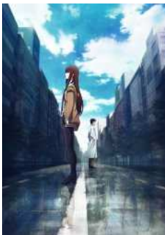
【Amazon.co.jp限定】劇場版 STEINS;GATE 負荷領域のデジャヴ 超豪華版(新録ドラマCD付)(完全数量限定) [Blu-ray]

<< : 「リヴァイが人気なものわかる」『進撃の巨人』第14話「まだ目を見れない -反撃前夜(1)-」を見た海外の反応 >> : 「ゴジラは何位？」海外のサイトが選んだ『歴代巨大怪獣映画トップ10』に対する海外の反応