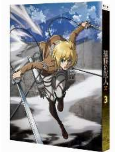
進撃の巨人 3 [初回特典・Blu-ray Disc ビジュアルノベル「ミカサ外伝」他(制作協力:ニトロプラス、プロダクション・I.G)]