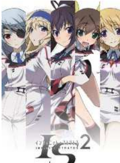
IS<インフィニット・ストラトス>2 ロング・バージョン EDITION [Blu-ray]

ヨーロッパではこういう話が年に何度か度々でているような。 以前も有名な画家の絵が路上マーケットで売られていたとニュースになっていた気が。 ともあれ、ギャラリーフェイクが連載していたらネタにしていたような話です。