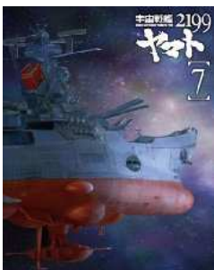
宇宙戦艦ヤマト2199 7 (最終巻) [Blu-ray]