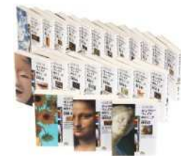
ギャラリーフェイク 全23巻セット (小学館文庫)