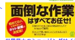
世界最大のショッピングサイトで稼ぐ! Amazon 輸入ビジネス入門