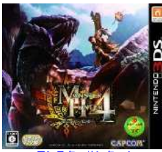
モンスターハンター4

ヨーロッパではこういう話が年に何度か度々でているような。 以前も有名な画家の絵が路上マーケットで売られていたとニュースになっていた気が。 ともあれ、ギャラリーフェイクが連載していたらネタにしていたような話です。