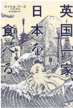
英国一家、日本を食べる

28 当時のフランスはオランダが日本から買い付けた工芸品を競って買ってくれたんだよね。 フランスでは開国前も開国後(万博など)も最近でも、 繰り返し日本ブームが起きる日本にとってのお得意様。 まあ、日本でも印象派〜パリ〜南仏と常にフランスのブームがあるからお互い様か。