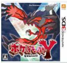
ポケットモンスター Y

●シュルズベリー、イギリス 一体どれだけのお宝が気付かれるのを待ちながら眠ってるんだろうな。 この国は長い歴史を持っているから、かなりの数があるに違いないぞ。