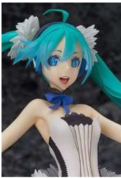
セブンスドラゴン2020 初音ミク TYPE2020 (1/7スケール PVC塗装済み完成品)