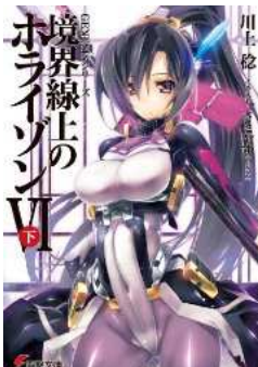
GENESISシリーズ 境界線上のホライゾン 6(下) (電撃文庫)