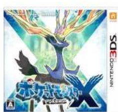
ポケットモンスター X