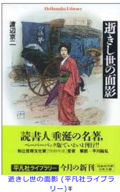
逝きし世の面影 (平凡社ライブラリー)F