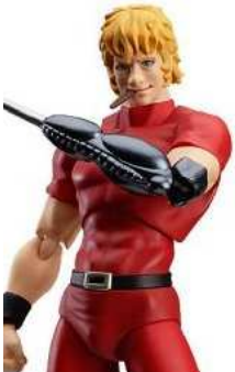
figma COBRA THE SPACE PIRATE コブラ (ノンスケール ABS&PVC 塗装済み可動フィギュア)