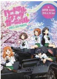
【Amazon.co.jp限定】ガールズ&パンツァー ～ハートフル・タンク・ディスク～ (杉本功描き下ろし絵柄ステールブックケース付)(完全数量限定生産) [Blu-ray]