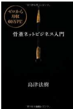
ゼロから月収60万円! 骨董ネットビジネス入門