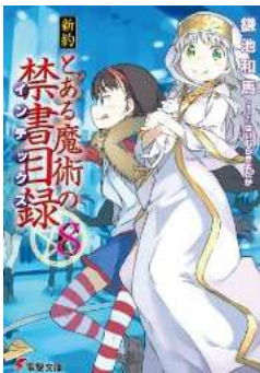
新約 とある魔術の禁書目録 (8) (電撃文庫)