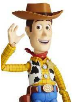
特撮リボルテック SERIES No.010 WOODY (ウッディ)

25 この手のお宝、中国の骨董品では更に高額な品いくらでもあるが日本の物ではめずらしい 国内にあり作者も名の知れた物なら重文級だろうか。とかど素人が言ってみる^^