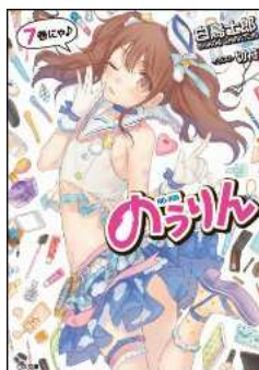
【Amazon.co.jp限定特典付き】のりりん 7 (GA文庫)