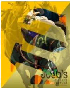
ジョジョの奇妙な冒険 Vol.8 (空気供給管に入り込むサンタナ型USBメモリ、全巻購入特典フィギュア応募券付き)(初回限定版) [Blu-ray]