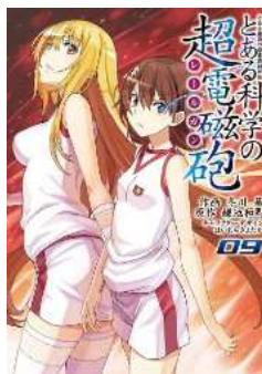
とある魔術の禁書目録外伝 とある科学の超電磁砲 (9) (電撃コミックス)