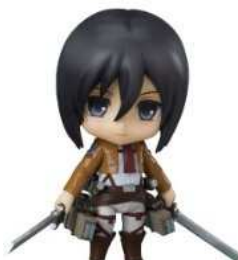
進撃の巨人 ねんどろいど ミカサ・アッカーマン (ノンスケール ABS&PVC塗装済み可動フィギュア)