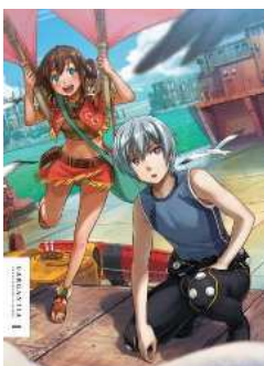
翠星のガルガンティア Blu-ray BOX 1