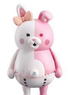
スーパーダンガンロンパ2 さよなら絶望学園 ねんどろいど モノミ (ノンスケール ABS&PVC塗装済み可動フィギュア)