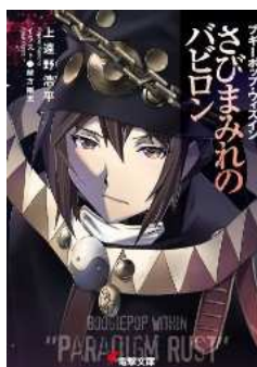
ブギーポップ・ウィズイン さびまみれのバビロン (電撃文庫)