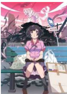
猫物語(白) 第一巻/つばさタイガー(上)(完全生産限定版) [Blu-ray] 猫物語(白) 第二巻/つばさタイガー(下)(完全生産限定版) [Blu-ray]

3 2chで話題になった時は1万5千円が9億円になってたけど大体19万ぐらい出したのか。それなりに高額だったんだね。あと落札したのが美術館なのは今後のためにも良かったのかな。いろいろ分かって良かった乙です 2013-07-16 23:08 : URL : 編集