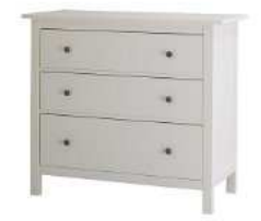
HEMNES チェスト (引き出し×3), ホワイト IKEA イケア