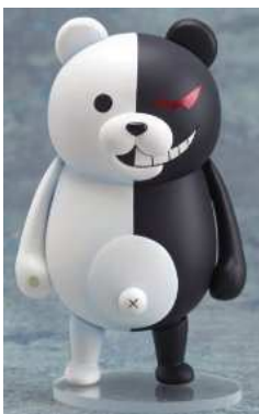
スーパードンガンロンパ2 きよなら絶望学園 ねんどろいど モノクマ (ノンスケール ABS&PVC塗装済み可動フィギュア)